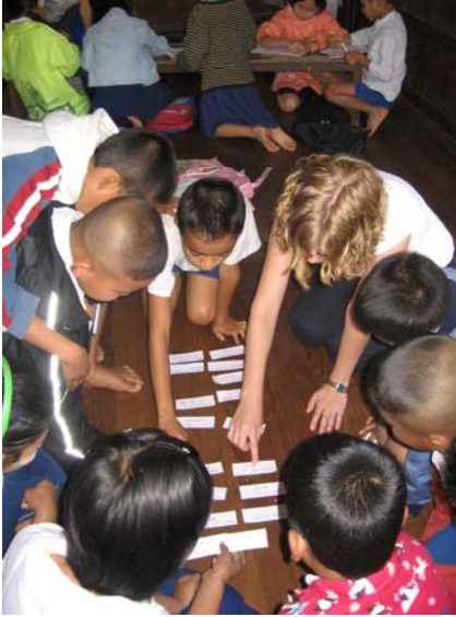
Une bénévole du Projet éducatif Estrie-Mae Sot explique un jeu de vocabulaire à des enfants birmans.